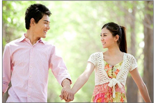
Hiểu về biện pháp tránh thai để tránh những hoài nghi không đáng có