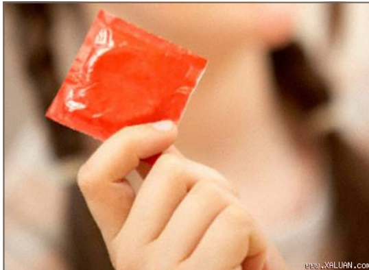
Lỗi không phải tại cái BCS

Tôi cố cãi: “Chỉ một chút dịch rơi vào trong thì làm sao có thể mang bầu được?”. Cả ba chiếc BCS nhìn nhau lắc đầu: “Cậu không hiểu gì cả, chỉ cần rơi dính vào âm đạo thì tinh trùng có trong tinh dịch đó cũng có thể xâm nhập vào trong âm đạo và khi ấy khả năng có thai là có thể xảy ra.”