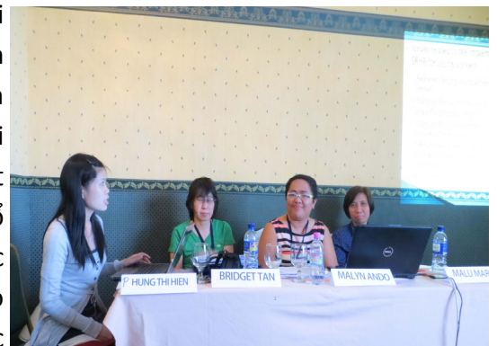
Phiên thảo luận về lao động di cư tại APF

Trong các ngày từ 6-8/4, Hội nghị Xã hội dân sự Hiệp hội các quốc gia Đông Nam Á (ASEAN) và Diễn đàn Nhân dân ASEAN 2013 (APF 2013) đã diễn ra tại thủ đô của Brunei. Hội nghị đã thu hút hơn 500 đại biểu đại diện cho các tổ chức xã hội dân sự (CSO) đến từ các nước ASEAN. Hội nghị đã tập trung thảo luận và đưa ra các khuyến nghị về các vấn đề khác nhau, từ nhân quyền, lao động di cư (LĐDC), phụ nữ và trẻ em... Phiên thảo luận về LĐDC đã giúp các thành viên hiểu được LĐDC còn đang là một trong những thành viên dễ bị tổn thương nhất của cộng đồng. Từ phiên thảo luận này, các thành viên đã ra bản khuyến chung trong đó nhấn mạnh đến việc Chính Phủ các nước tôn trọng, bảo vệ và thực hiện các quyền của người LĐDC trong đó có quyền sức khỏe sinh sản, tình dục bởi đó là những quyền cơ bản của con người; loại bỏ sự bất bình đẳng giữa người di cư và người dân địa phương, đồng thời cần có cách tiếp cận đa quốc gia trong vấn đề LĐDC.