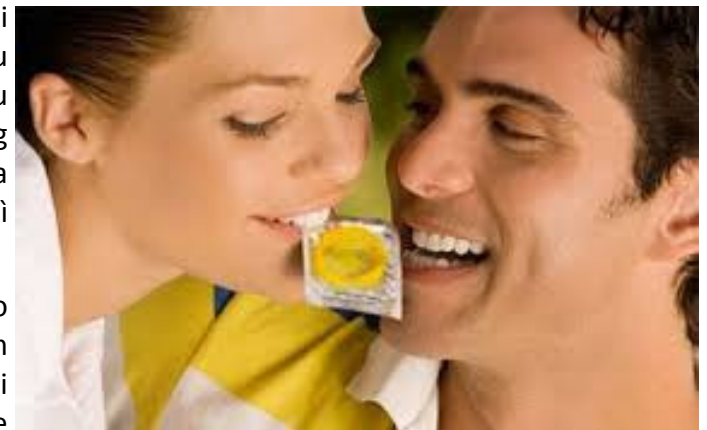
Cùng tránh thai, chung hạnh phúc

Tôi thẫn thờ nhìn lên trần nhà. Cô ấy không muốn mang thai và sinh con lúc này. Làm thế nào với cái thai trong bụng cô ấy đây? Hay là cưới? Thoáng nghĩ như vậy, tôi bật dậy đi tìm chìa khóa mở tủ. Phải xem sổ tiền tiết kiệm được là bao nhiêu. Cũng may là thời gian trước Tết do chịu khó tăng ca tôi cũng để dành được kha khá tiền. “Cưới thôi, lần này thì vừa được trâu, vừa được nghe”. Thoáng mỉm cười, tôi quyết định sang phòng trọ của người yêu để thảo luận với cô ấy về việc này, hi vọng cô ấy sẽ chấp thuận. Trên đường đi tôi sẽ ghé vào một cửa hàng thuốc để mua hộp bao cao su làm quà chuộc lỗi. Đó cũng là lời hứa của tôi về việc cùng chia sẻ trách nhiệm tránh thai với cô ấy trong tương lai để chúng tôi không phải gặp những tình huống bị động như lần này.